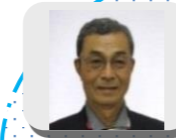
相談役 安井のつづき

一年も半分を過ぎたあたりから、夏季休暇はどうしよう? 年末年始は? と、「旅行に行きたい!」という思いがフツツと浮かんできます。そして今年もこの時期がやって参りました! こどもが相手をしてくれる間は、多少無理をしてもめいっぱい楽しい思い出が作れたらな～と思います。今から節約して間に合うかな?