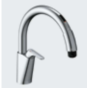
B5 SF-NAB451SYX ¥87,000 SF-NAB451SYXN ¥90,000