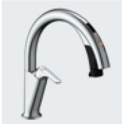
H5 SF-NAH451SY SF-NAH451SYN ¥124,000