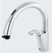
B5 RSF-671A RSF-671NA