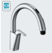
乾電池式B5 SF-NAB454SYX SF-NAB454SYXN ¥97,000