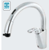
乾電池式B5 RSF-672A RSF-672NA