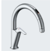
A5 SF-NAA451SY ¥103,000 SF-NAA451SYN ¥106,000