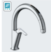
A7 (エコセンサー付) SF-NAA471SY ¥124,000 SF-NAA471SYN ¥127,000