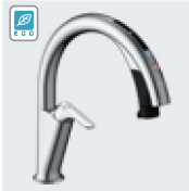
H7 (エコセンサー付) SF-NAH471SY SF-NAH471SYN ¥145,000