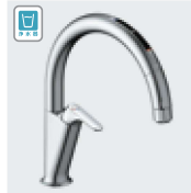
A6 (浄水器ビルトイン形) JF-NAA466SY(JW) ¥153,000