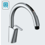
B6 (浄水器ビルトイン形) JF-NAB466SYX(JW) ¥137,000