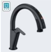
H6 (浄水器ビルトイン形) / サテンブラック JF-NAH461SY/SAB(JW) JF-NAH461SYN/SAB(JW) ¥223,000