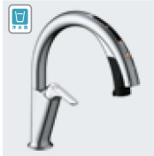
H6 (浄水器ビルトイン形) JF-NAH461SY(JW) JF-NAH461SYN(JW) ¥168,000